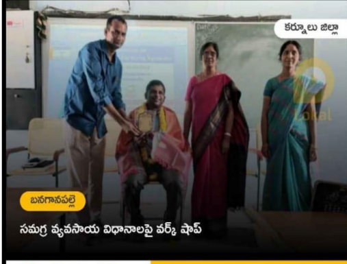
సమగ్ర వ్యవసాయ విధానాలపై వర్క్ షాప్